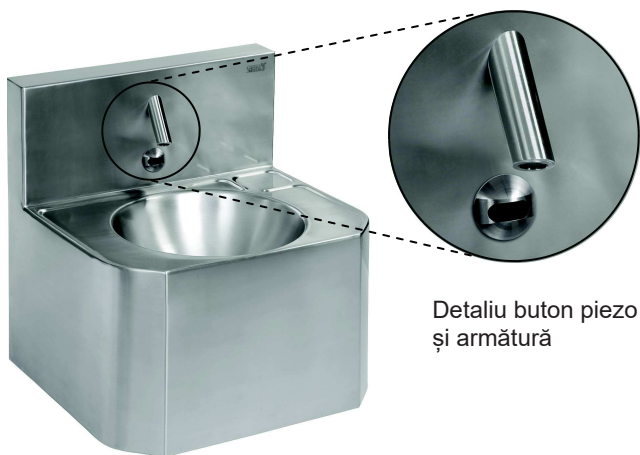
Detaliu buton piezo și armătură